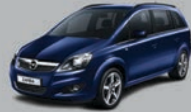
▲ Albastru Regal

Lăsa Opel Zafira să îți reflecte personalitatea. Alege dintr-o gamă de culori de bază, metalizate sau mica.