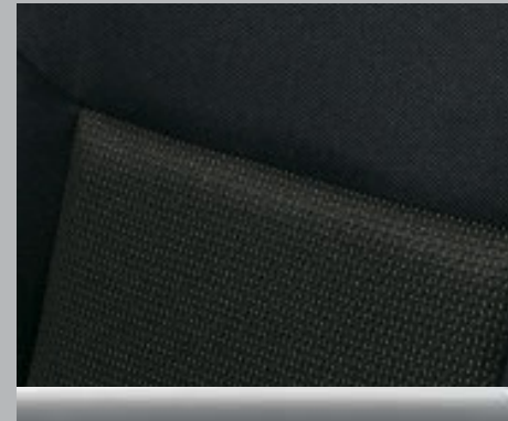
▲ Alpha/Elba Gri închis. Elemente decor: Crom mat.

● = disponibilă - = indisponibilă 1 Optional.