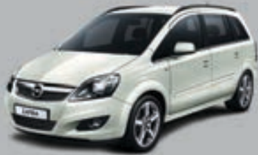
▲ Alb Summit