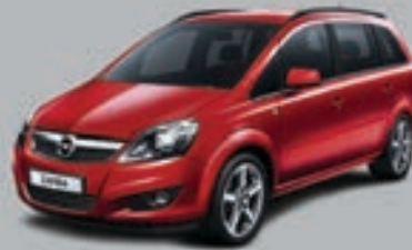
▲ Roșu Power