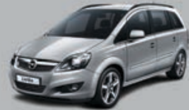
▲ Argintiu Sovereign