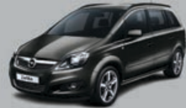
▲ Gri Phantom