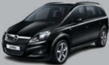
▲ Carbon Flash